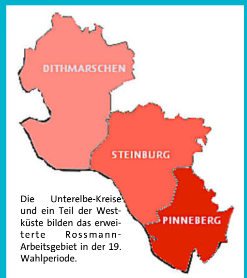
Die Untereibe-Kreise und ein Teil der Westküste bilden das erweiterte Rossmann-Arbeitsgebiet in der 19. Wahlperiode.

Im Team des Bundestagsabgeordneten wird sich in erster Linie die wissenschaftli-