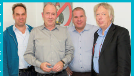
ROSSMANN IM GESPRÄCH MIT POST-ARBEITNEHMERVERTRETERN.